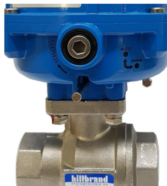
Levier de sélection en position AUTO